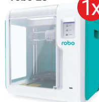
Drukarka 3D robo E3