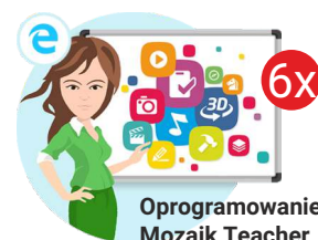
Oprogramowanie Mozaik Teacher

Całkowita wartość zadania (wnioskowana kwota wsparcia finansowego plus wkład własny – suma wkładu finansowego i rzeczowego) wraz z procentowym udziałem dotacji i wkładu własnego