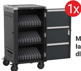
Mobilna stacja ładująca EWENT dla 30 laptopów