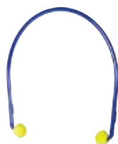
Ochronniki słuchu na pałąku