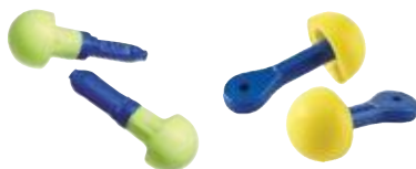
Wkładki przeciwhałasowe typu „Push-to-fit”