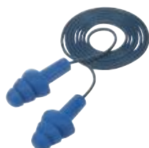
Wkładki przeciwhałasowe widoczne dla wykrywaczy metali