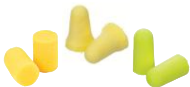
Rolowane piankowe wkładki przeciwhałasowe