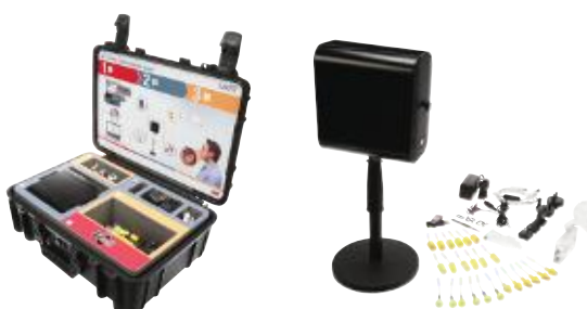
System 3M™ E-A-Rfit™ Dual-Ear Validation