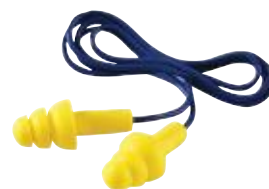
Wkładki przeciwhałasowe wielokrotnego użytku